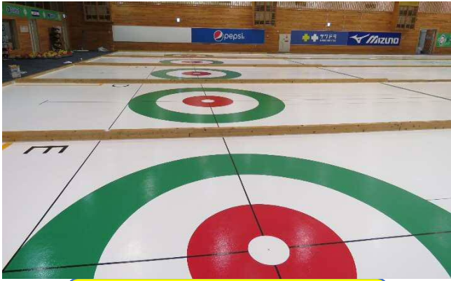
シートが乾きました