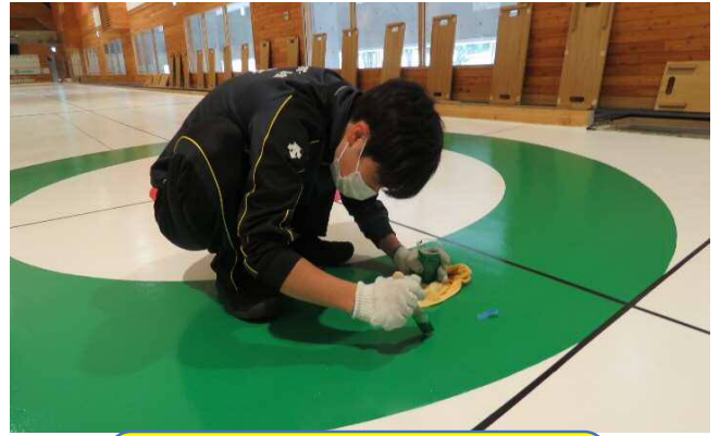
ペンキが剥がれている部分は丁寧に塗りなおしました！